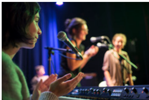
→ ATELIER « RÉUSSIR À MALAKOFF »