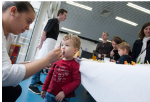
→ ATELIER « RÉUSSIR À MALAKOFF »