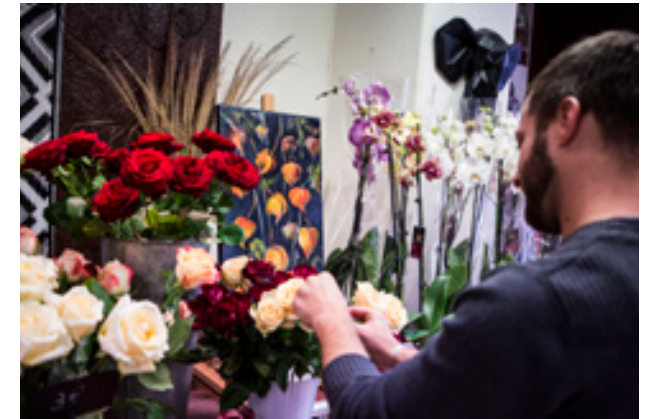
→ ATELIER « RÉUSSIR À MALAKOFF »