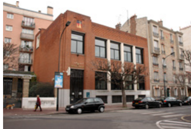
→ ATELIER « RÉUSSIR À MALAKOFF »