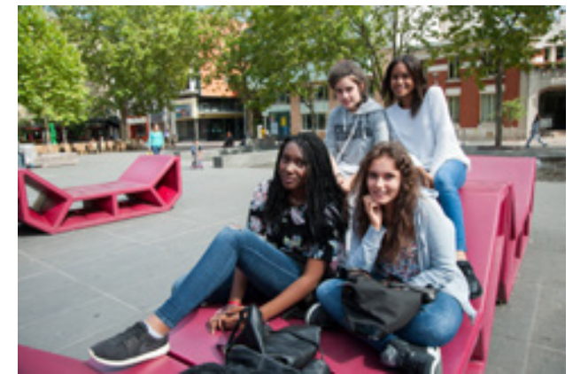
→ ATELIER « RÉUSSIR À MALAKOFF »