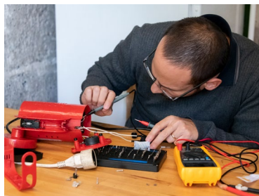
Le Repair café