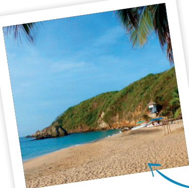
Plage de Mazunte