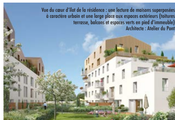
Vue du cœur d'îlot de la résidence : une lecture de maisons superposées à caractère urbain et une large place aux espaces extérieurs (toitures terrasse, balcons et espaces verts en pied d'immeuble) Architecte : Atelier du Pont

Les espaces verts seront nombreux et plantés. Bouygues livrera des bacs à compost pour les futurs habitants.