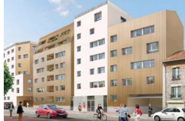
Côté architecture, la part belle est laissée aux jeux de retrait et de volumes, afin de « donner de l'air » au linéaire. Architecte : Atelier du Pont

Une étude acoustique et vibratoire a été menée préalablement et le choix architectural retenu permet de limiter l'impact de ces nuisances pour les habitants du quartier et des futures constructions.