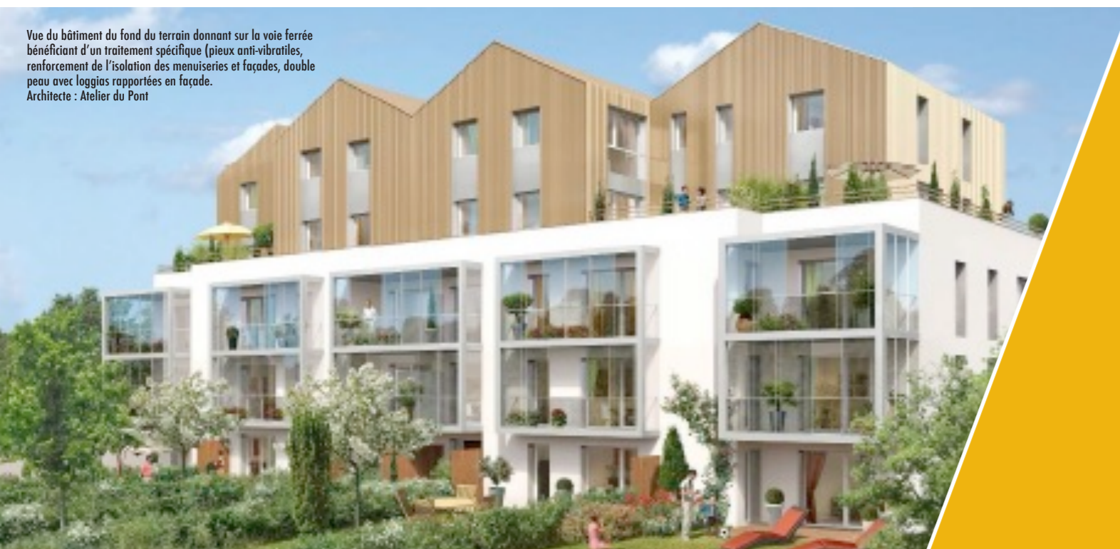
Vue du bâtiment du fond du terrain donnant sur la voie ferrée bénéficiant d'un traitement spécifique (plieux anti-vibratiles, renforcement de l'isolation des menuiseries et façades, double peau avec loggias rapportées en façade. Architecte : Atelier du Pont