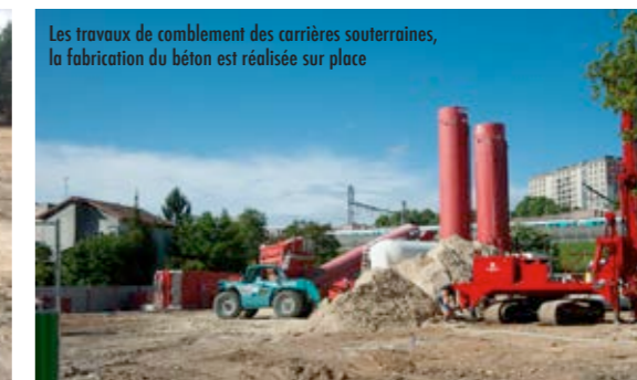
Les travaux de comblement des carrières souterraines, la fabrication du béton est réalisée sur place