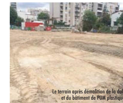
Le terrain après démolition de la dalle et du bâtiment de PUM plastiques

Le chantier de la Résidence UniVert sur le site Dolet a commencé avec la démolition des bâtiments de l'entreprise PUM Plastiques et de la dalle existante ainsi que par les travaux de comblement des carrières.