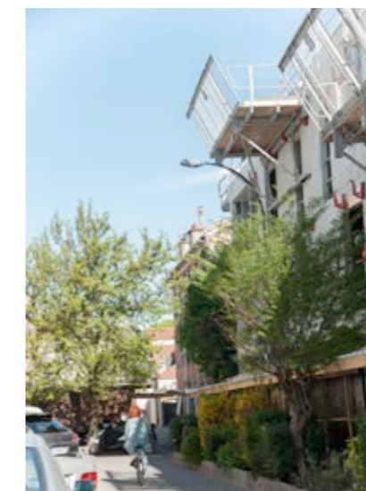
Architecte : Valéro Gadon