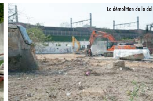
La démolition de la dalle

La démolition du site PUM Plastiques par l'aménageur de la ZAC, la SEM 92, a été réalisée au mois d'avril. Les travaux de comblement des carrières ont été réalisés sur ce site sous lequel existent de nombreuses galeries creusées lors de son exploitation. Bouygues Immobilier a pris le relais avec la mise en œuvre des fondations par pieux pendant l'été.