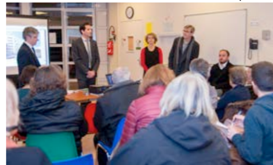
La réunion de concertation du 5 mars 2015 au sujet du démarrage des travaux sur le site Dolet