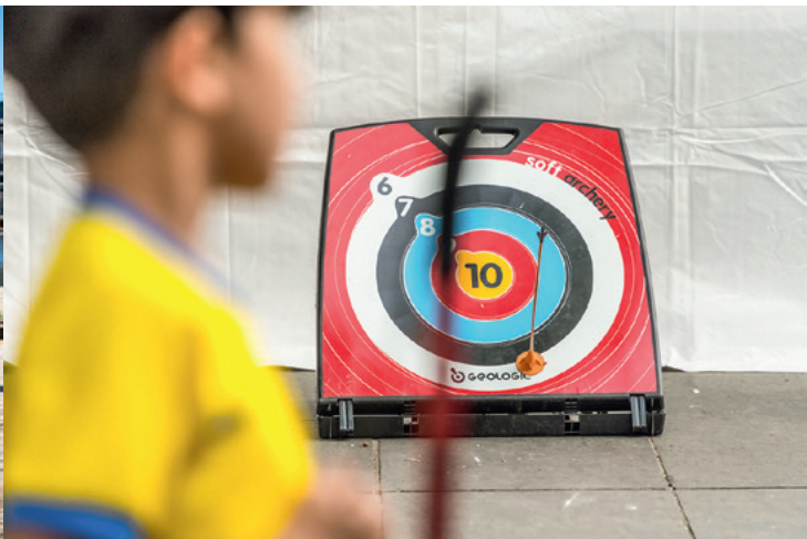
4 juillet : l'escale sportive, mail Maurice-Thorez.