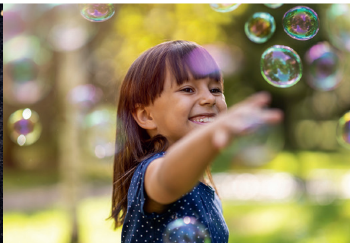
13 juin : Fête de quartier sud, parc Léon-Salagnac