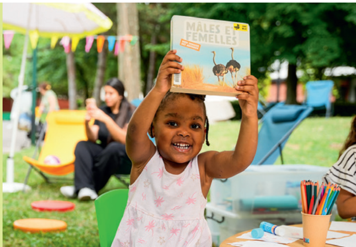
29 août : observation des insectes, Ferme urbaine.