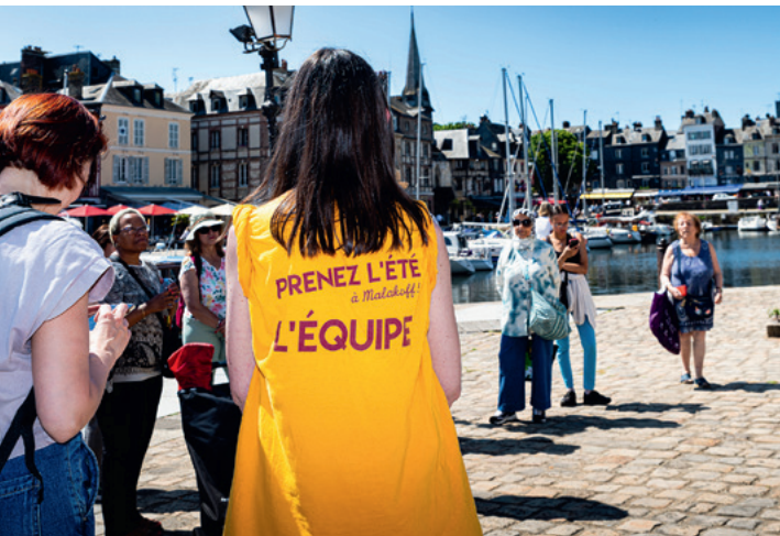
Du 29 juillet au 29 août : Prenez l'été, dans toute la ville.