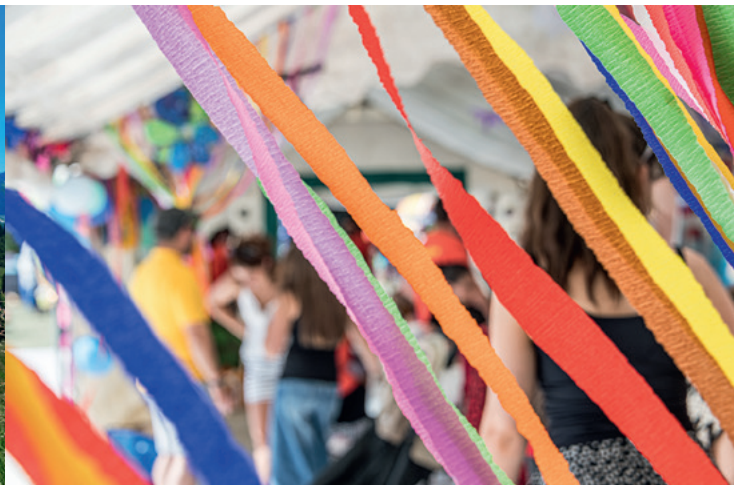
Du 19 au 21 juin : Malakoff en fête, boulevard de Stalingrad et parc Léon-Salagnac.