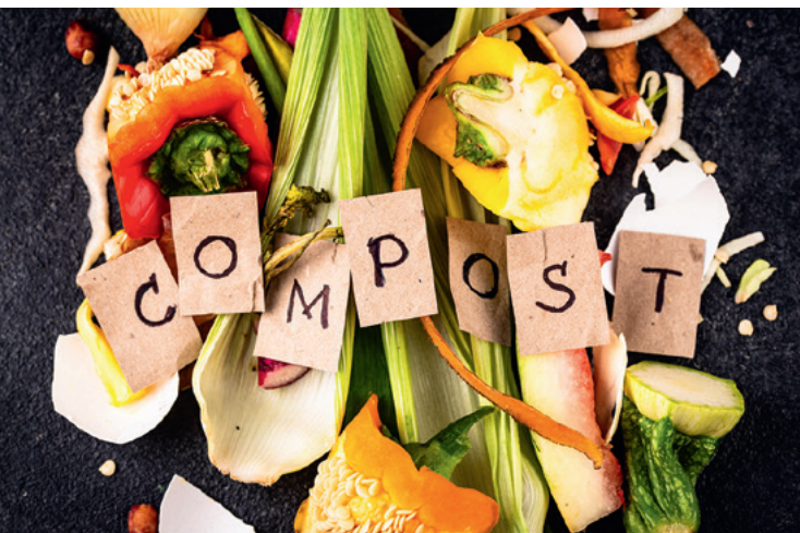
18 juin : atelier compost, Maison des arts.