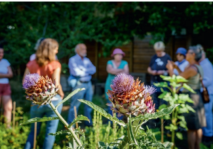
23 et 24 mai : Journées Nature, Ferme urbaine.