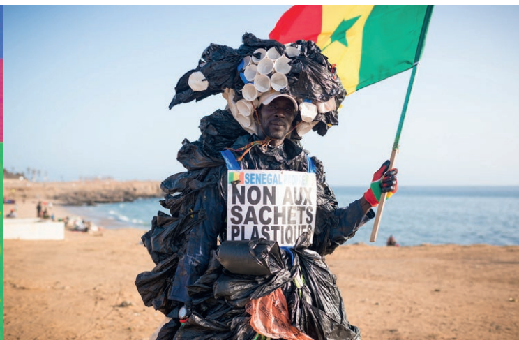
9 mai : Sensibilisation à la pollution en Afrique, Maison de quartier Henri-Barbusse.