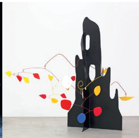
1 er juin : conférence Calder, rêver en équilibre, hôtel de ville.