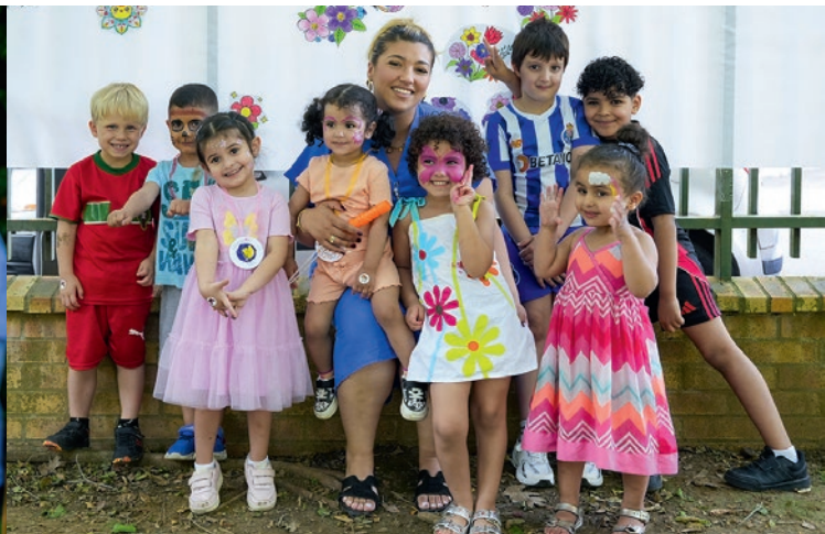
23 mai et 6 juin : Fêtes de quartier Centre et Nord.