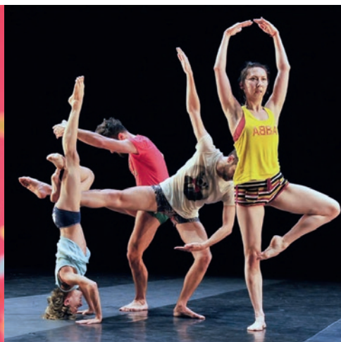
12 mai : Panorama danse , Théâtre 71.