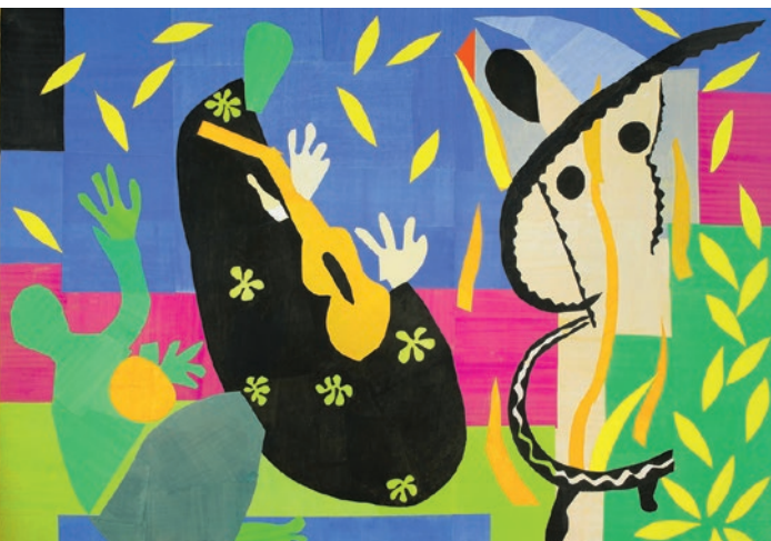
18 mai : Conférence Matisse 1941-1954, hôtel de ville.