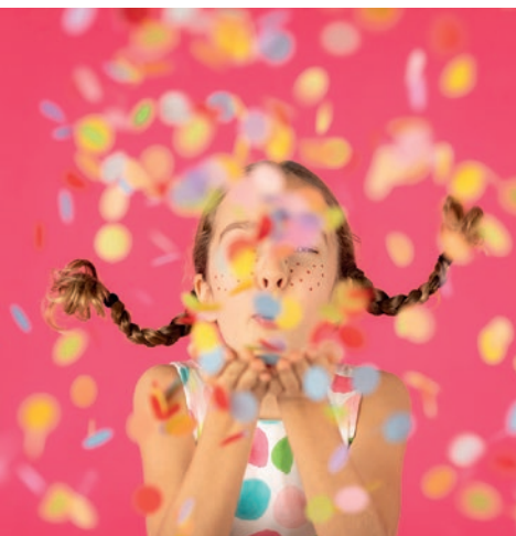
6 mai : carnaval des enfants, parcours à travers la ville.