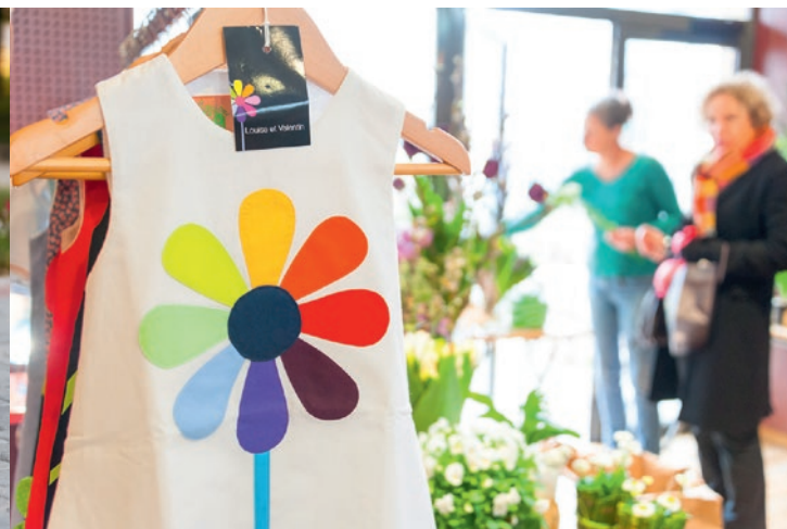
11 et 12 avril : Marché des créateurs, Maison de la vie associative.