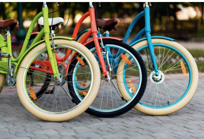
11 avril : bourse aux vélos, école élémentaire Jean-Jaurès.