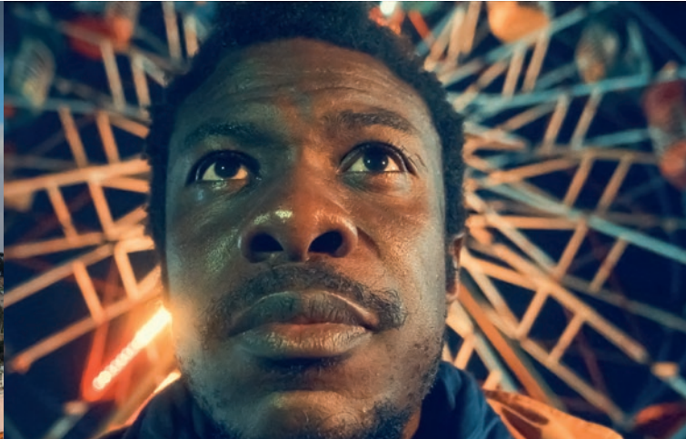
16 et 17 avril : Jérusalem dans la peau , espace Angela-Davis et Maison de quartier Henri-Barbusse.