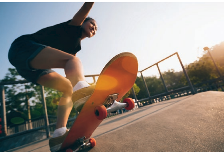
Du 10 au 17 avril : SportiVal, dans plusieurs lieux de la ville.