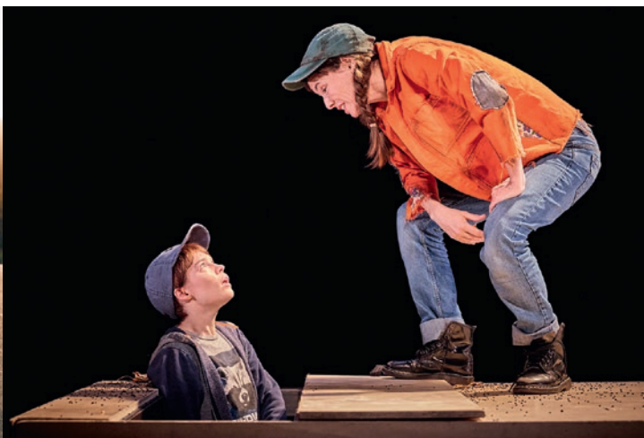
8 avril : Je suis trop vert, Théâtre 71.