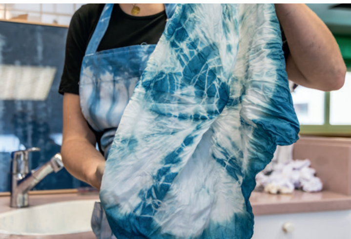
8 novembre : visite des tiers-lieux La Tréso et le Toboggan.