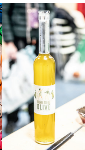
22 novembre : fabrication d'huile d'olive, Ferme urbaine.