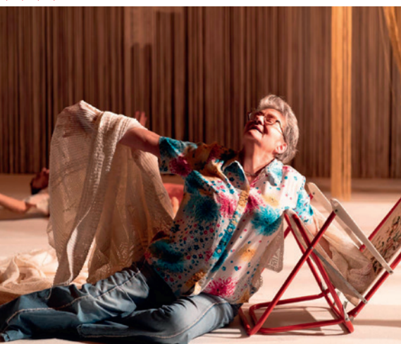
13 et 14 novembre : Annette , Théâtre 71.