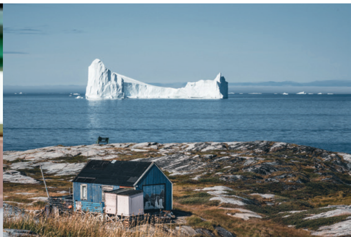
13 novembre : L'Arctique, témoin n° 1 du réchauffement climatique ?, médiathèque Pablo-Neruda.