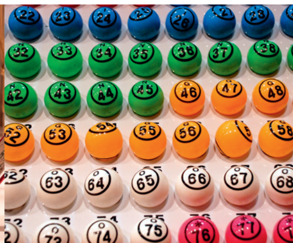
8 novembre : loto du comité des fêtes, salle Jean-Jaurès.