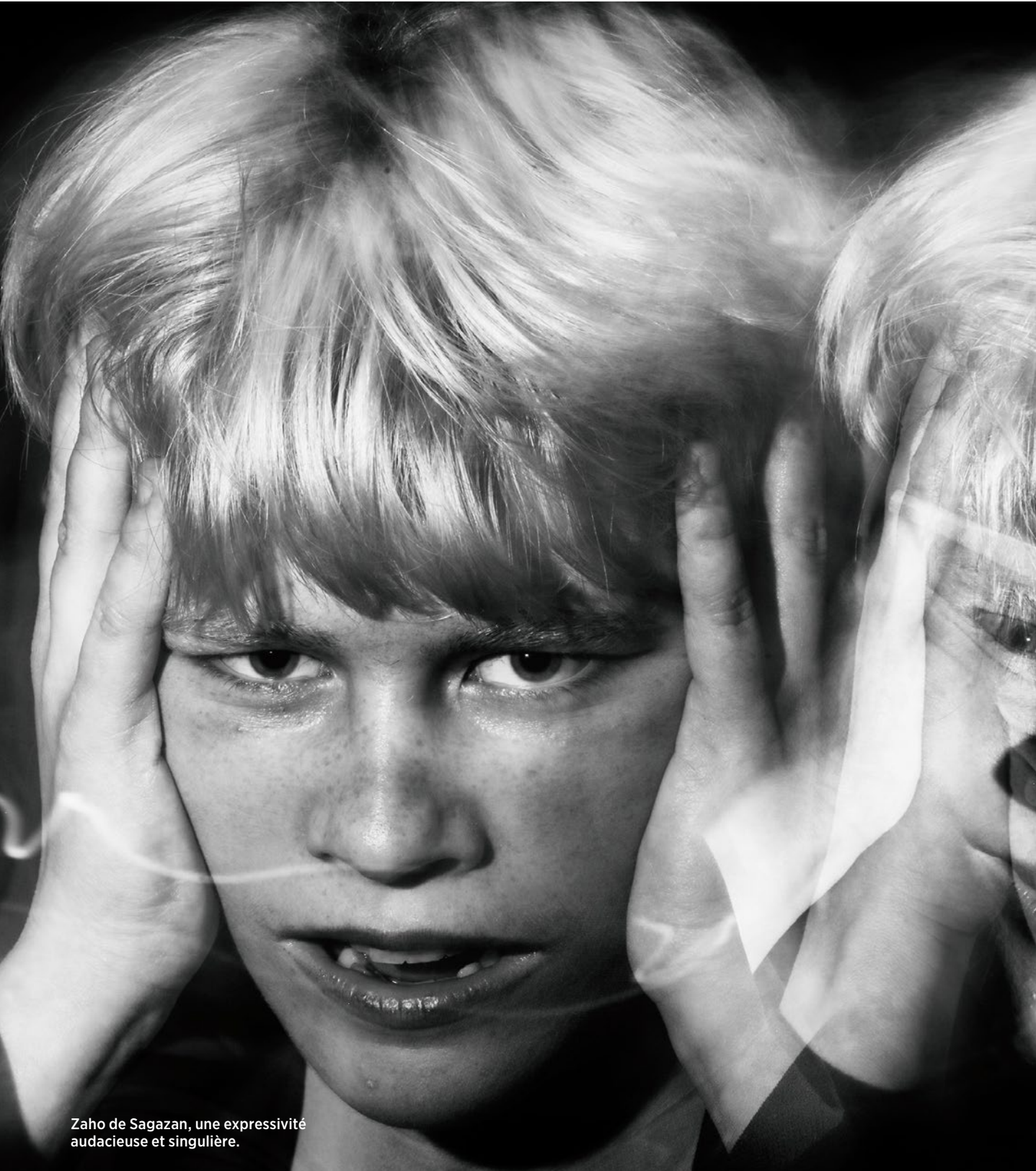
Zaho de Sagazan, une expressivité audacieuse et singulière.