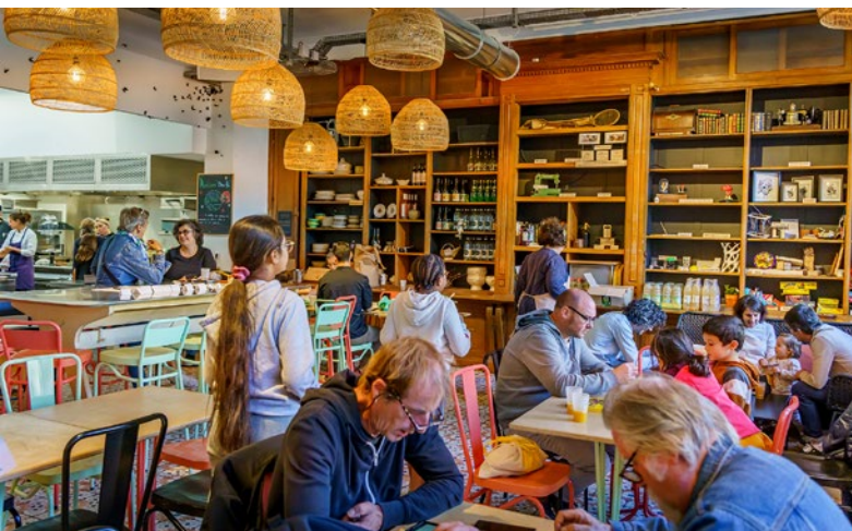
14 octobre : visite de la Tréso