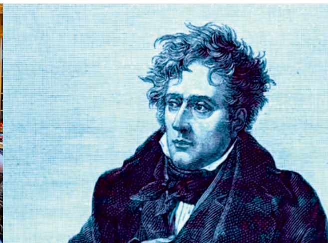
11 octobre : visite de la maison de Chateaubriand, avec l'Aclam

Inscrivez-vous à la newsletter hebdomadaire sur malakoff.fr