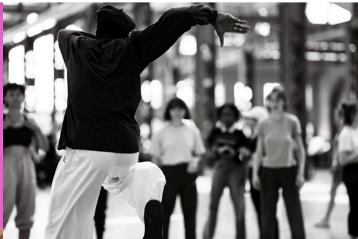
30 septembre : Balade urbaine, départ rond-point Youri-Gagarine