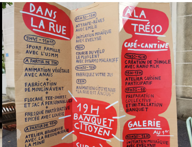
16 septembre : festival de La Trésó