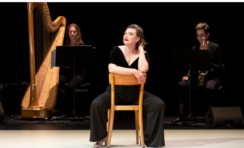
3 et 4 octobre : Carmen , Théâtre 71