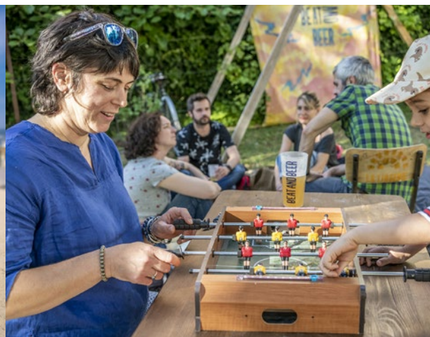
21 juillet : animations du Vendredi de l'été, place Léo-Figuères.