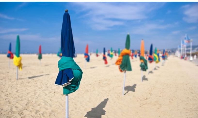
Juillet et août : journée à la mer avec Prenez l'été.