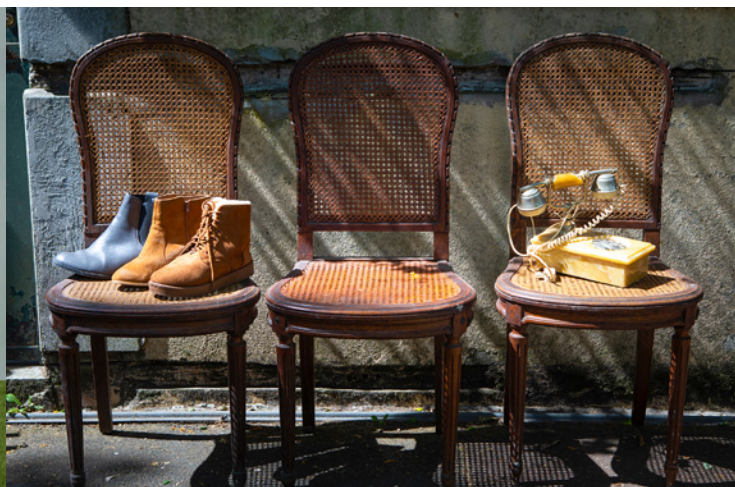
13 mai : vide-greniers, rue Raymond-David et boulevard Camélinat.