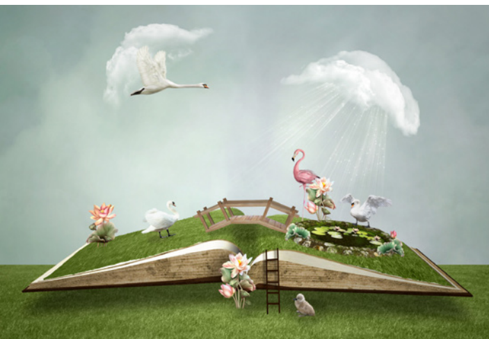
Du 27 au 28 mai : Livres en plein air, parc Salagnac.