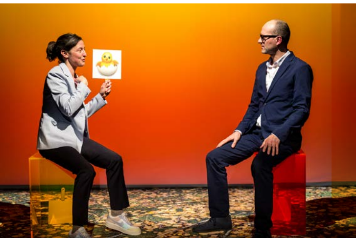
19 et 20 avril: Elles vivent , Théâtre 71.