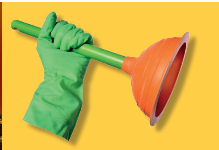
13 avril: La ventouse , cinéma Marcel-Pagnol.