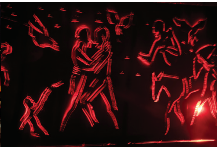
12 octobre : répétition publique d' Indiscrétion amoureuse , Fabrique des arts.