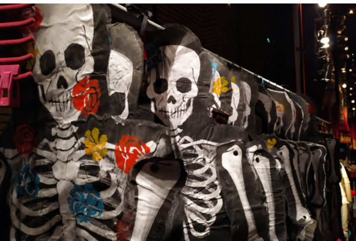
18 octobre : Le bal marionnettique, Théâtre 71.