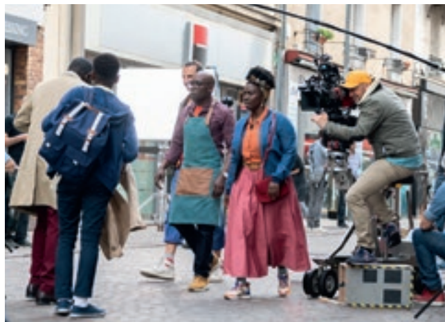
↑ La rue Béranger a servi de décor à la série Il a déjà tes yeux , réalisée par Lucien Jean-Baptiste.