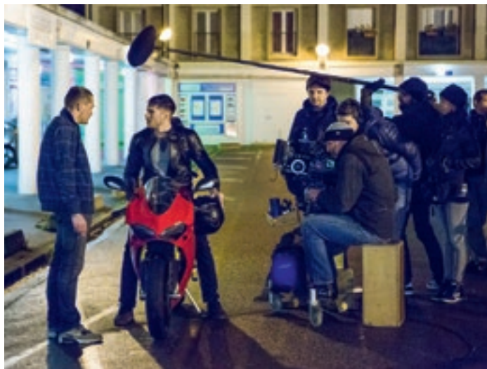
← Lieu de tournage pour professionnels et étudiants de l'EMC, accueil de sociétés de postproduction, éducation artistique des plus jeunes, séances de ciné-clubs: Malakoff vibre pour le cinéma!