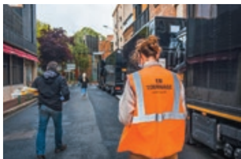
↓ Chaque tournage nécessite une autorisation d'occupation de la voirie délivrée par la Ville.