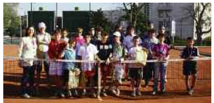
Photo de groupe des vainqueurs du tournoi de tennis organisé par la section de l'USMM le 1 er avril dernier. Ce sont 110 jeunes et 88 adultes qui ont participé.