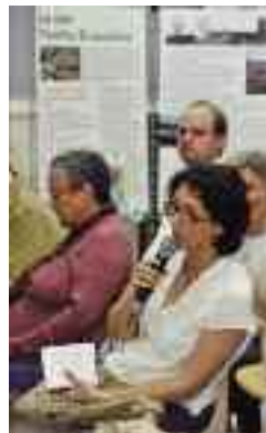
Une habitante intervient lors de la réunion du 10 mai

Lors de la réunion publique du 10 mai dernier, Madame le Maire a rappelé les objectifs de la ZAC Dolet-Brossolette : « Ce projet s'inscrit dans la poursuite de la construction de notre ville avec l'ambition de maintenir l'équilibre social, urbanistique et environnemental qui la caractérise. (...) Je veux redire combien est importante pour nous la participation des habitants. Ils concourent à la construction d'une ville qui reste à échelle humaine, respectueuse des attentes et des besoins de sa population, riche de sa diversité, où il fait toujours mieux vivre ensemble ». Cette opération d'urbanisme a la vocation de répondre aux besoins des Malakoffiots en matière de logement, de maintien des activités commerciales, d'amélioration du cadre de vie tout en respectant les exigences environnementales (lutte contre l'étalement urbain, normes HQE (Haute Qualité Environnementale) des bâtiments...). Elle répond également aux objectifs du Schéma Directeur d'Ile-de-France qui préconise de développer, en proche couronne parisienne, une offre de logement diversifiée et donc accessible à toutes les catégories de populations.