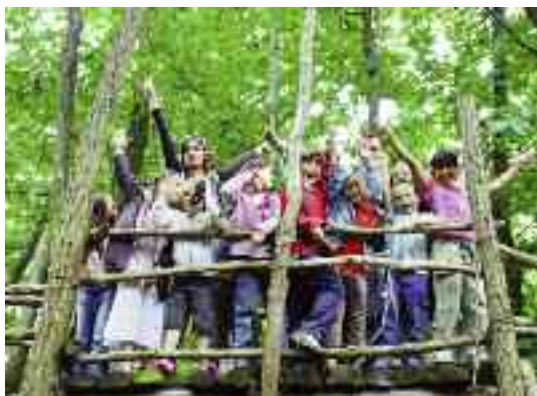
L'accueil de loisirs Saint-Pierre du Perray est ouvert à tous

En ce qui concerne les 11-14 ans, trois structures sont à leur disposition dans le nord, le centre et le sud de la ville, respectivement l'accueil Voltaire, le Centre de Loisirs Adolescents et la Maison des Jeunes et de Quartier Barbusse.