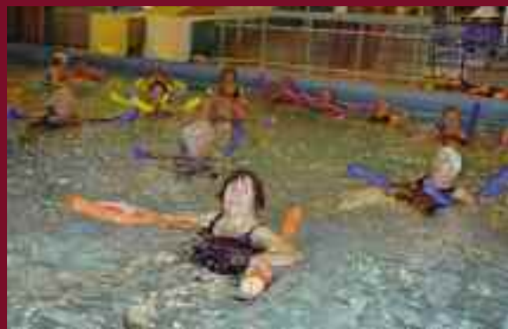
L'aquagym permet aux seniors d'avoir une activité physique tout en douceur

Pour ce faire, une politique résolue d'accès au sport pour tous est menée. Pour la rentrée sportive, toutes les aides et leurs modalités d'accès vous sont présentées dans la colonne ci-contre.