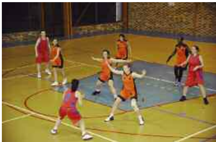
L'équipe féminine de basket a réalisé une belle saison et termine 3 e de son championnat.

La fin de la saison sportive est l'occasion d'un bilan pour différents sports pratiqués au sein de l'USMM. C'est à dessein que nous avons classé les résultats entre masculins et féminines. L'occasion de s'apercevoir que le sport... a souvent un genre.