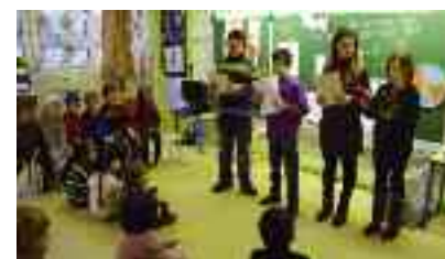
Les grands font la lecture aux petits.

Les enfants ont pu faire admirer leurs œuvres lors d'une exposition, présentée le 14 juin.