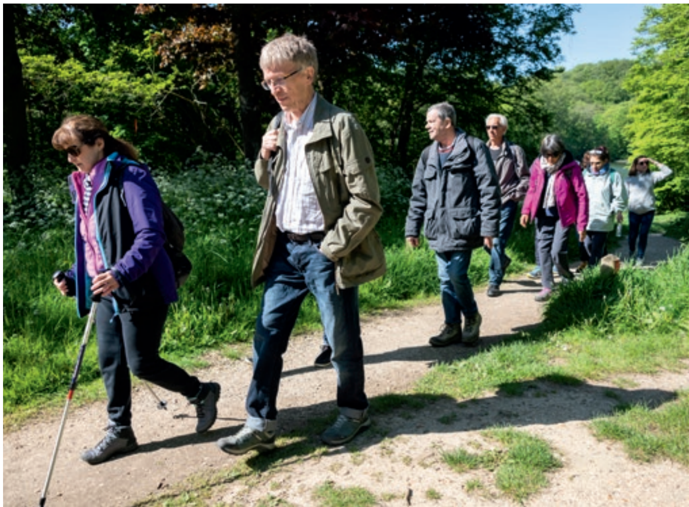
↑ Les activités associatives et municipales encouragent les seniors à rester actifs.