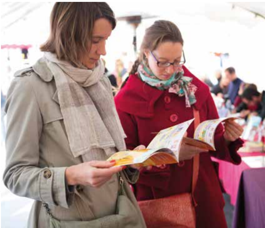
© Tourfik Oulmi / Tulipe Noire