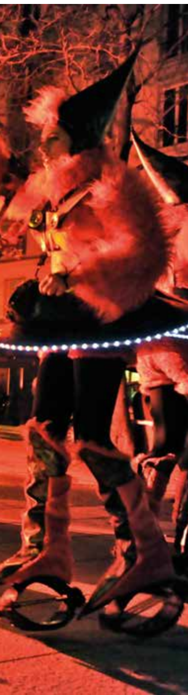
Au programme, cette année : Les Tiglings, qui émerveilleront petits et grands.