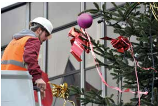
Mise en place et décoration du grand sapin de Noël de la Place du 11-Novembre-1918.

Le service culturel de la Ville participe aussi aux festivités. Il s'est chargé d'organiser la fête qui aura lieu le 16 décembre au soir: le concert d'une chorale de quatre classes (CM2) des écoles Paul-Bert et Jean-Jaurès (accompagnées d'élèves du conservatoire) et des déambulations de groupes d'arts de rues. Ce service organise la logistique de l'événement et assure l'accueil des compagnies. Les Tiglings (petits lutins bondissant joyeusement sur leurs chaussures à ressort) et les Gnomikys (drôles de créatures poilues venues de Sibérie) sont en route pour Malakoff! La Maison de la vie associative (MVA) est aus-