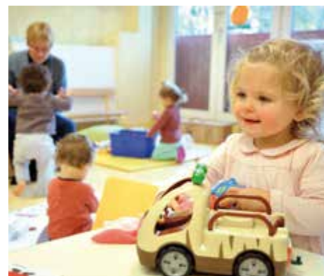
Jeux, découverte du milieu aquatique participent au développement de l'enfant.