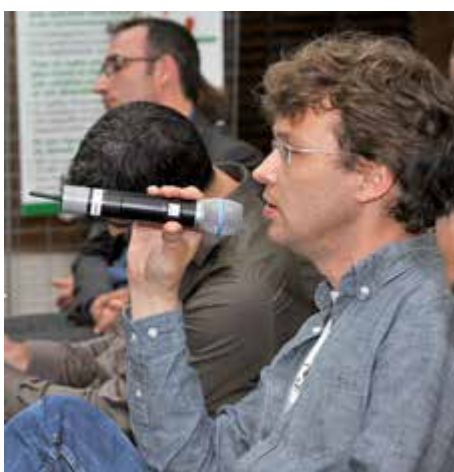
Lors des ateliers sur le PLU, les habitants ont fait des propositions concrètes sur l'aménagement urbain du Malakoff de demain.