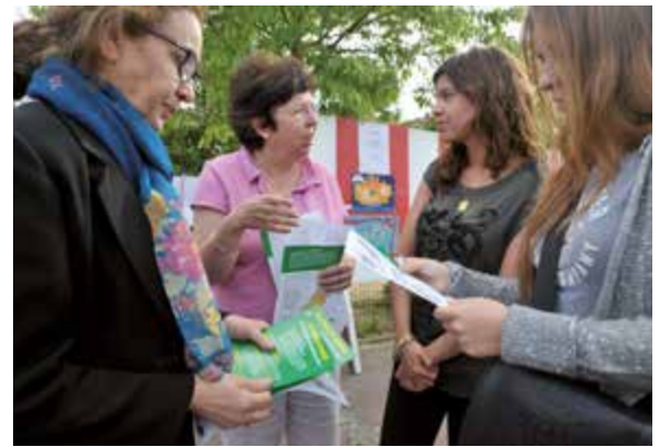
L'avenue Augustin-Dumont en sens unique avec la mise en place d'une piste cyclable était une demande des habitants des Conseils de quartiers.