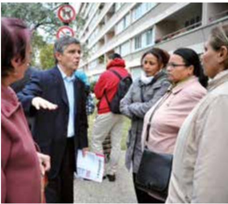
Les visites de quartiers sont l'occasion pour les habitants d'échanger avec les élus et personnels communaux.