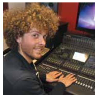
Zoom EMC: graines de pros