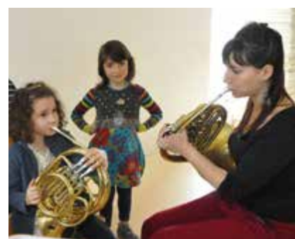
Développement durable et citoyenneté, art et culture, sport et loisirs sont au programme des Nap.