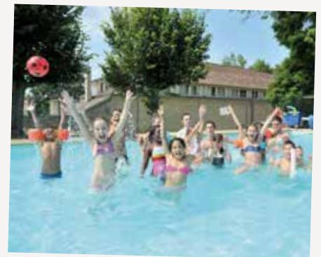
Centre de vacances Fulvy

5 rue Avaulée. Pour connaître les permanences de l'été, consultez le répondeur du CMP de Malakoff, au 01 46 55 65 66.