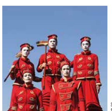
Animations ludiques, sportives, musicales, artistiques, déambulatoires, la Fête de la ville est une orchestration d'idées festives.