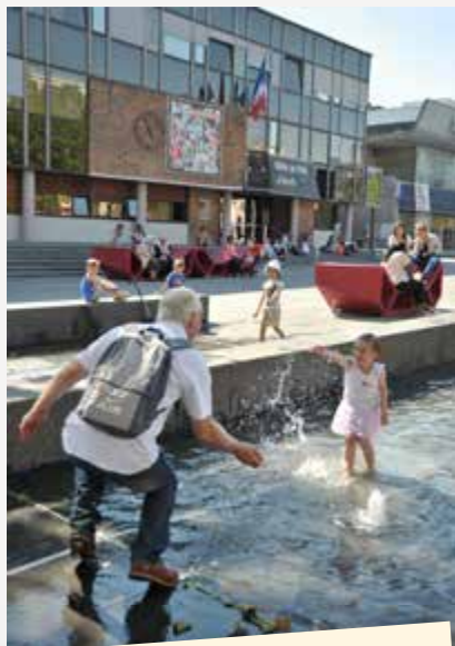
place du 11-Novembre-1918