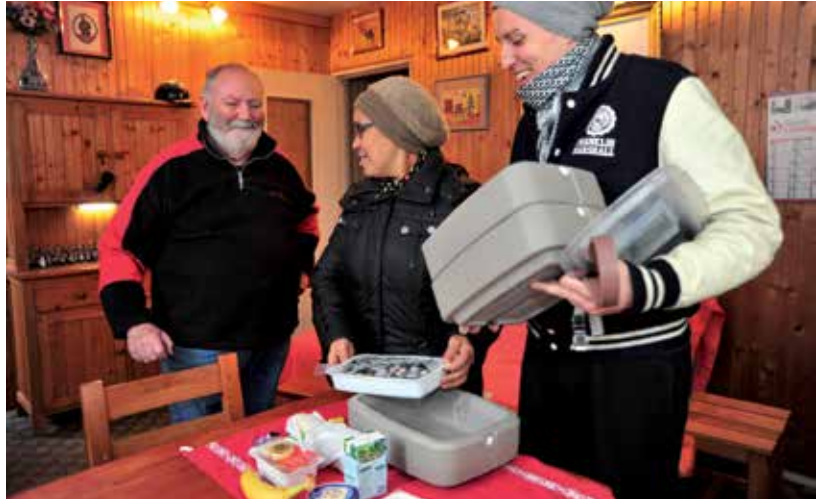
Préparés le matin même à la cuisine Léon-Salagnac, les plats du service de portage de repas sont livrés à domicile, du lundi au vendredi.