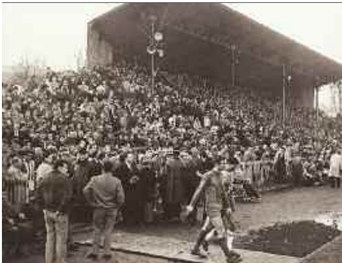
En décembre 1965, Malakoff rencontre l'équipe d'Ajaccio en Coupe de France. Le stade Marcel-Cerdan est comble