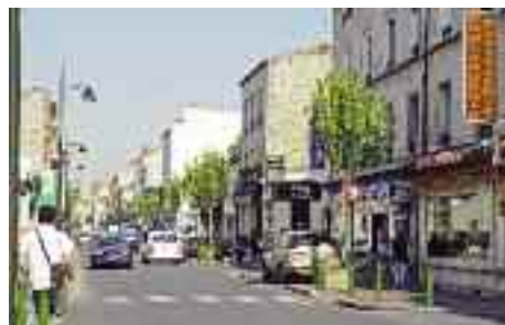
L'avenue Pierre-Larousse est un axe commercial important que la Ville suit avec attention.