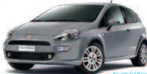
Nouvelle Fiat Panda