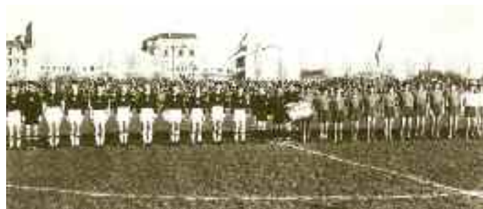
En décembre 1953, au stade Cerdan, Malakoff rencontre la Hongrie, alors championne olympique. La recette des 10 000 spectateurs payants sera versée à la Caisse des écoles.