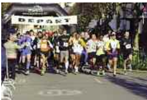
Avec 840 coureurs bravant la bise glaciale, les 38 e Foulées ont battu un record

Ils étaient 83 sur les Foulées cette année, permettant le versement de 1 280 euros à l'Association française des malades atteints de porphyrie (AFMAP). Ceci sans compter une contribution du comité d'entreprise. Enfin, sur l'année 2011, ce sont 11 000 euros qui ont été récoltés au travers des différentes courses.