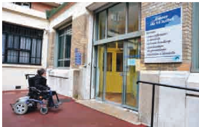
La commission communale d'accessibilité vise à améliorer l'accès des personnes en situation de handicap notamment, à la voirie et aux bâtiments communaux

Enfin, le Conseil a approuvé le rapport 2010 de la commission communale d'accessibilité pour les personnes handicapées.