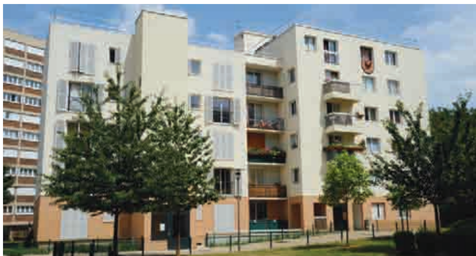
Le 26 rue Pierre Valette a été profondément rénové.

Au 26, rue Pierre-Valette, le dernier immeuble de l'ancienne cité Million, construite à l'après-guerre et démolie au début des années 2000, a été entièrement réhabilité et restructuré. La réfection de l'isolation, des menuiseries et façades a permis d'améliorer la performance énergétique du bâtiment. Une nouvelle toiture végétalisée lui offre une isolation naturelle tout en ralentissant l'écoulement des eaux de pluie. De janvier 2010 au printemps 2011, les travaux ont permis la réfection de l'installation électrique, de la plomberie, des revêtements de sols et peintures, etc. Sur les 28 logements, dix ont été entièrement restructurés et bénéficient d'une nouvelle distribution des pié-