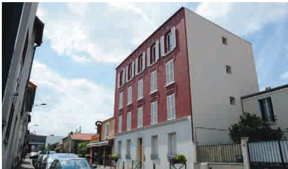
La nouvelle façade du 70 rue Guy Môquet.

immeuble de briques datant des années 20, vient d'être entièrement réhabilitée. Menés de janvier 2010 à mai 2011, les travaux ont doté le bâtiment d'une isolation thermique et phonique de qualité. Ils ont également permis la mise aux normes en matière d'installations électriques et de sécurité incendie, la réfection des planchers et de l'étanchéité de la toiture, le rééquipement des salles de bains, l'installation d'une ventilation mécanique contrôlée et d'un chauffage individuel au gaz. Par ailleurs, deux nouveaux logements ont été créés dans les anciens ateliers situés dans la cour intérieure. Installée avec sa fille et son mari dans l'un de ces 3 pièces en duplex, Anna Sima se réjouit de son nouveau cadre de vie. «C'est presque comme une maison, s'étonne-t-elle. J'apprécie d'être au rez-de-chaussée, de pouvoir profiter de