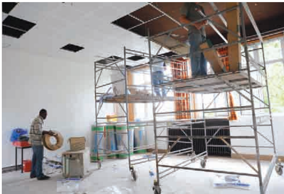
Une meilleure insonorisation pour l'annexe du conservatoire

Pour les écoles de la ville, les centres de vacances, la salle du Conseil municipal et le conservatoire, la période estivale aura été l'occasion de se refaire une beauté.