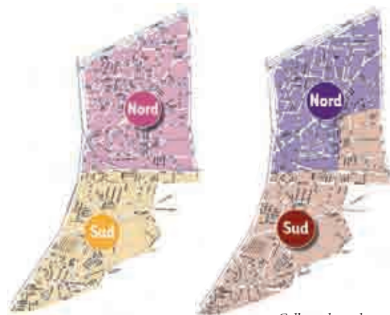
Collecte des encombrants

SECTEUR NORD Les mercredis 7, 14, 21, 28 sept. et 5 oct. SECTEUR SUD les jeudis 8, 15, 22, 28 sept. et 6 oct