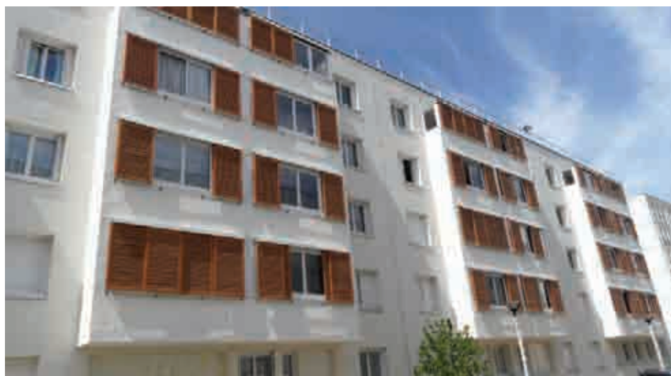
Réhabilitation en profondeur pour le 210 avenue Pierre-Brossolette.