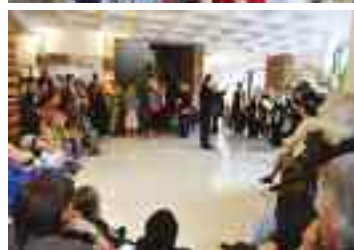
La chorale du conservatoire.