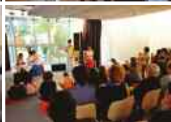
La classe théâtre du conservatoire.