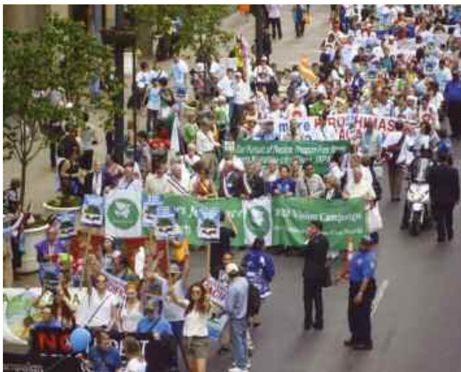
Le 2 mai, 15 000 pacifistes défilaient dans les rues de New York. Six Malakoffiots étaient dans la foule.

Le séjour des six pacifistes a commencé en beauté : le 30 avril et le 1 er mai, une conférence internationale alternative, organisée pour la première fois par les ONG 2 , a rassemblé 1000 participants à Riverside Church, célèbre église ayant notamment accueilli Martin Luther King et Nelson Mandela. A cette occasion, le secrétaire général de l'ONU, Ban Ki Moon,