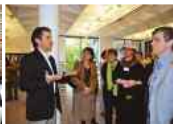
Les commentaires de l'architecte et de l'ensemble de l'équipe des médiathécaires..