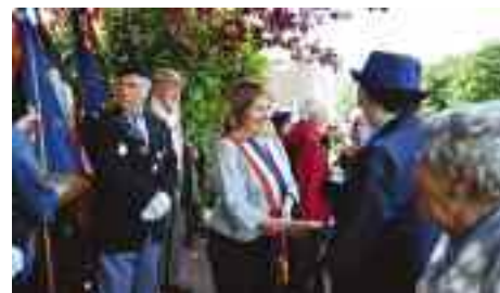
Madame le Maire rend hommage à Jean Moulin, considéré comme l'un des principaux héros de la Résistance, mort en 1943.