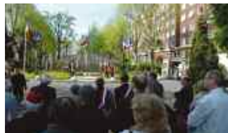
La FNDIRP (Fédération Nationale des Déportés et Internés Résistants et Patriotes) était présente lors de la commémoration des victimes de la Déportation du 25 avril.