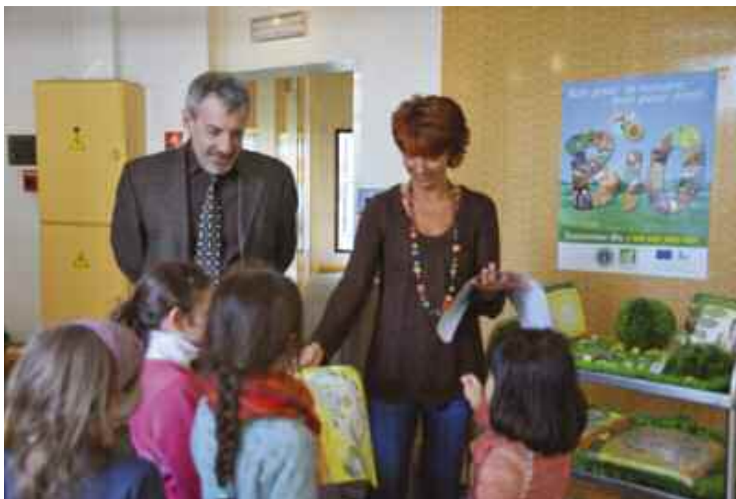
En présence de Monsieur le Directeur et de la diététicienne, le bio fait son entrée à l'école Jean-Jaurès.

❖ «L'introduction du bio dans la restauration scolaire ne cède pas à un effet de mode. Ce choix réfléchi s'inscrit dans le développement durable et la préservation de l'environnement qui sont des points essentiels du programme municipal. Aujourd'hui, près de 90 % des enfants scolarisés fréquentent le restaurant scolaire sans aucune condition restrictive. Une situation à mettre au compte de la pratique du quotient familial et du service public. Alors que l'alimentation est un enjeu de santé publique, nous avons, avec le bio, une carte importante à jouer sur la qualité et l'éducation alimentaire. Et ce, malgré le surcoût induit qui ne sera pas reporté sur les familles.