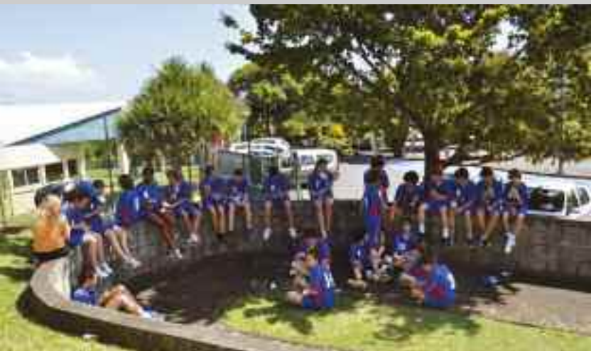
Les couleurs de Malakoff à l'Île de la Réunion.

«Le voyage et le sport = deux manières de partager des expériences avec les autres»