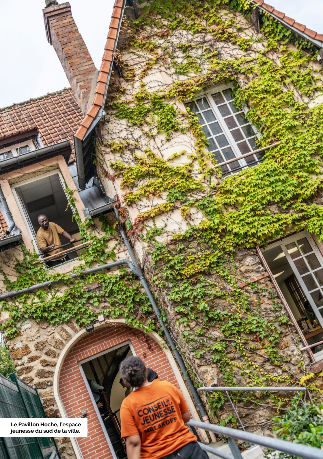
Le Pavillon Hoche, l'espace jeunesse du sud de la ville.