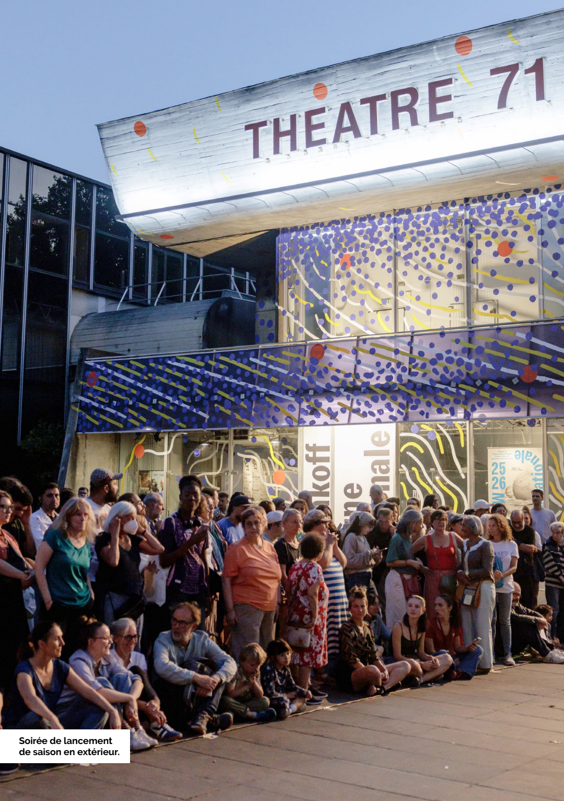
Soirée de lancement de saison en extérieur.