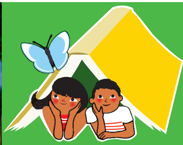
Du 21 juin au 18 juillet: Lisez l'été, dans toute la ville.