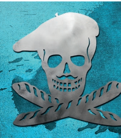
Du 14 au 22 juin : Shohan Design, atelier Kraft.