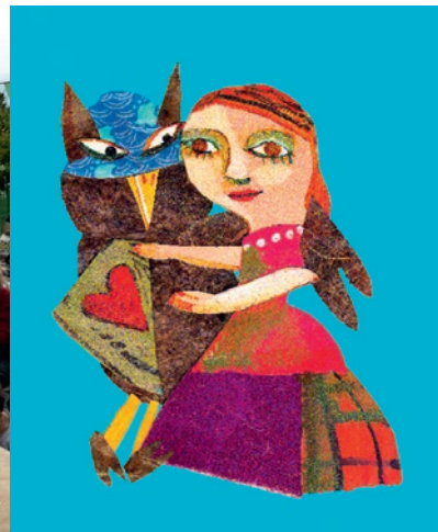
Jusqu'au 29 juin : exposition La métamorphose, médiathèque Pablo-Neruda.