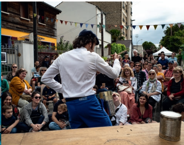
28 juin : festival Au coin de l'impasse, villa Marie-Antoinette.