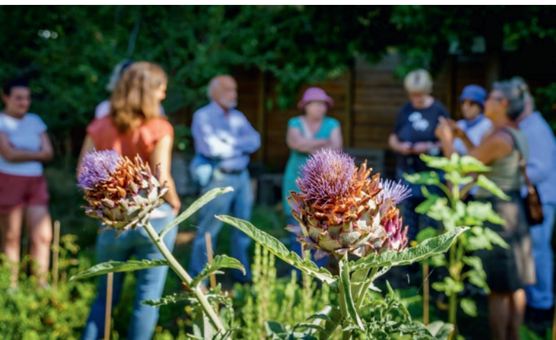
29 juin : portes ouvertes de la Ferme urbaine.