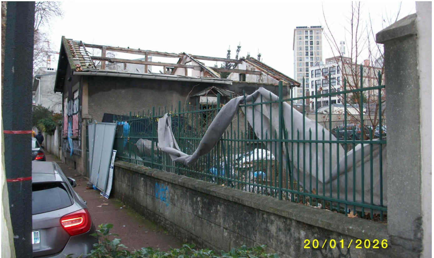
Photo antérieure à l'incendie prise au droit du 112 boulevard Carnot en un coin du 111.