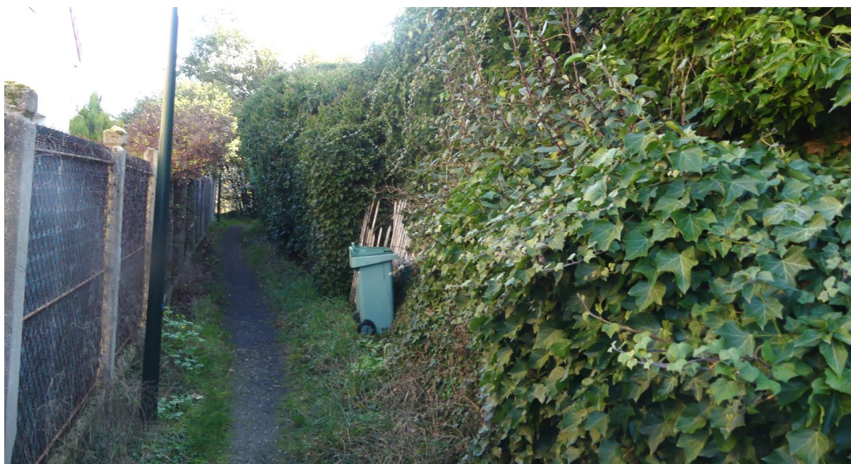
Illustration façade long-pan nord

Nous soulignons également que la façade long-pan nord est entièrement masquée par la végétation. De notre point de vue, il n'est pas exclu que cette dernière soit également déformée.