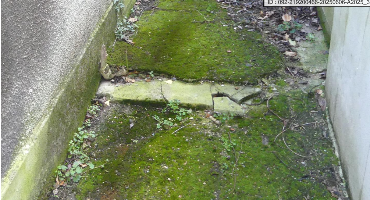
Illustration – Présence d'une racine de végétation et gonflement du sol