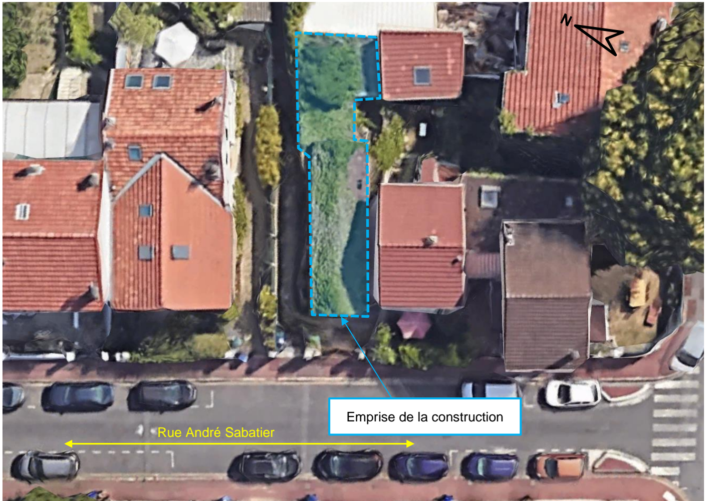
Vue aérienne – Localisation de la construction

Nous retrouvons sur la vue aérienne ci-dessous sa localisation et son emprise :