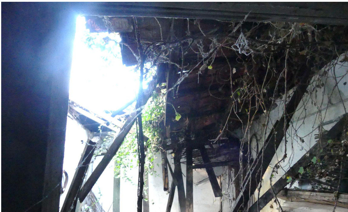
Photographie prise depuis une fenêtre partiellement condamnée

La couverture est assurée par des tuiles en terre cuite.