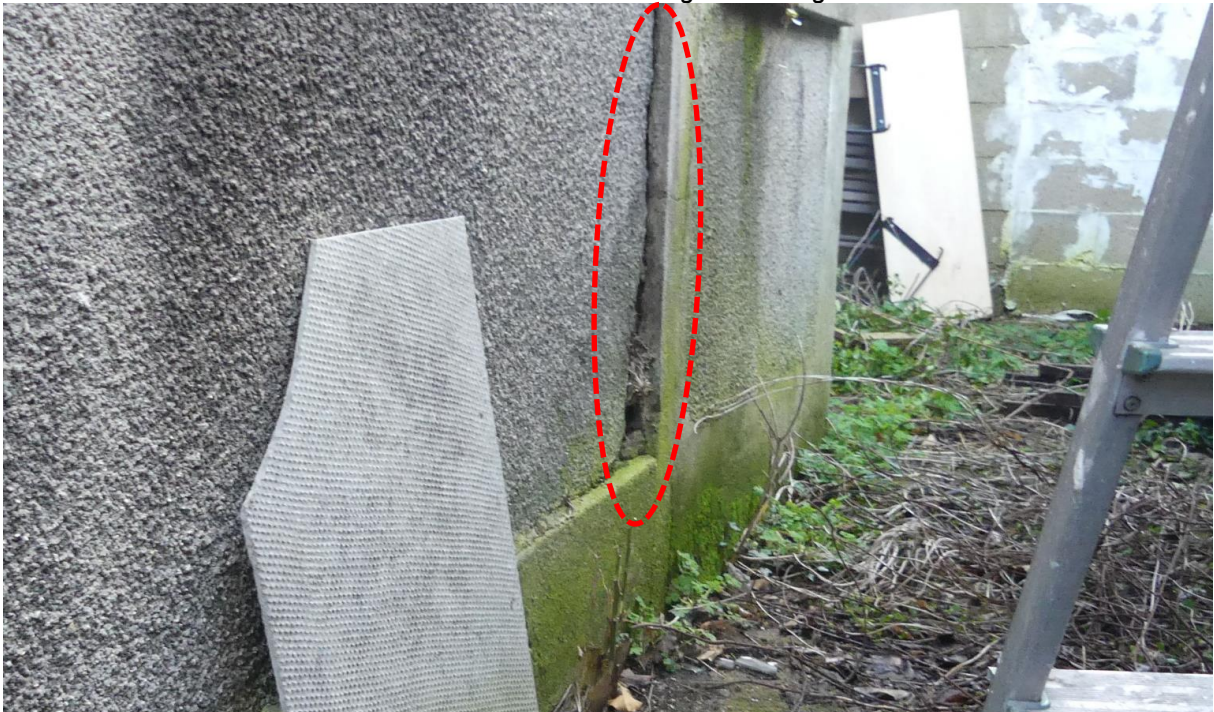
Détérioration du liant entre les blocs de façade et le chaînage vertical

L'inclinaison de la façade est importante. Ce désordre traduit une instabilité de la façade.