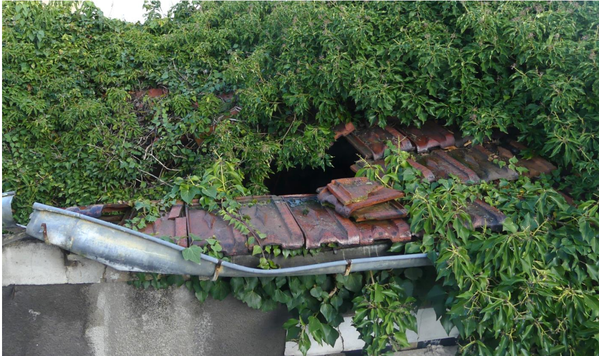
Photographie de la toiture prise depuis la maison voisine

La charpente de la maison dont une grande partie est actuellement en ruine, est en bois massif constituée de chevrons et liteaux disposés sur des pannes en appuis sur les murs pignons.