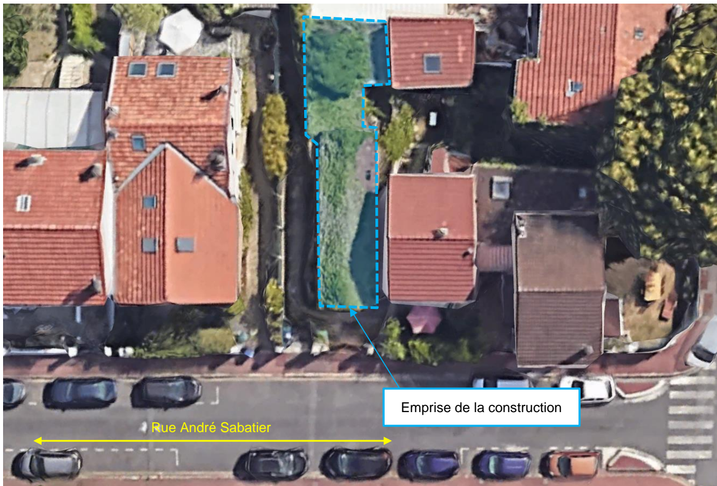
Vue aérienne – Localisation de la construction

Suite à la constatation de désordres au niveau d'une maison située au 37 rue André Sabatier à Malakoff (92), il a été réalisé un examen visuel sur les parties visibles et accessibles.