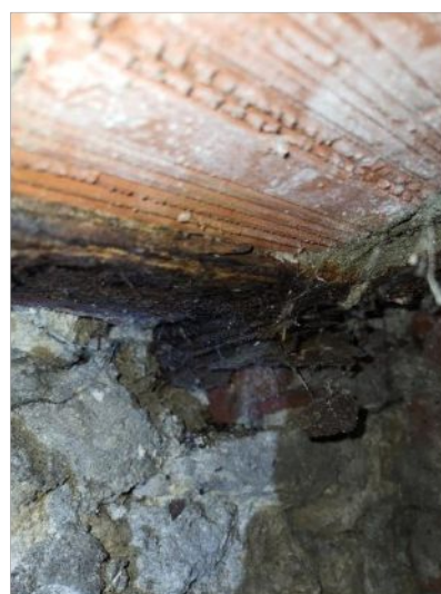
Photos – poutrelles métalliques en très mauvais états (corrosion feuilletante/foisonnante)