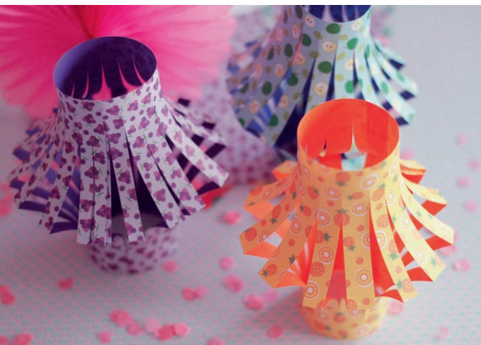
15 mai : fabrication de lanternes en papier à la médiathèque