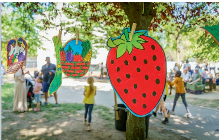
25 mai et 1 er juin : fêtes des quartiers Nord (parc du Centenaire) et Sud (parc Salagnac)