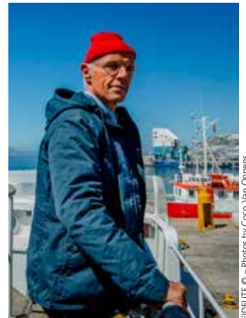
FIDÉLITE © - Photos by Coco Van Oppens

Qualification Barbusse > 20h, préau de l'élémentaire Barbusse, 2 rue Jules-Guesde