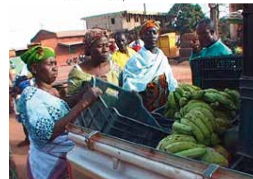
Extrait du film Africascop

Si vous souhaitez prendre part à la commission Mémoire et Patrimoine, contactez la Maison de la vie associative au 01 55 48 06 30.