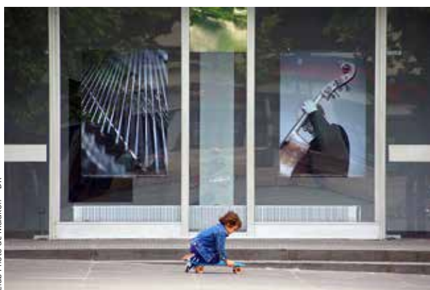
Club Photo de Malakoff - DR