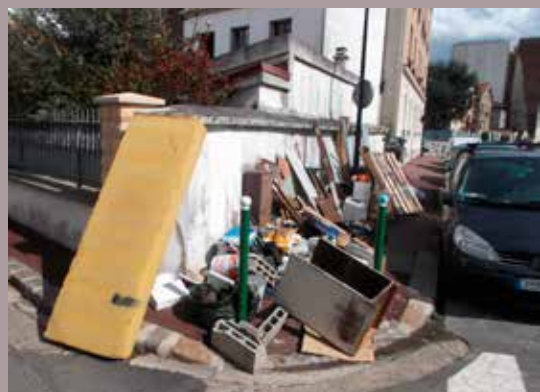
Ville de Malakoff