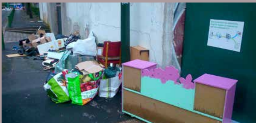
Ville de Malakoff - DR