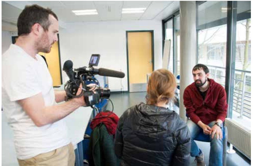
« Malakoff et moi » veut donner la parole à tous les habitants. Après l'enquête réalisée auprès de quatre-vingts habitants, la démarche se poursuit jusqu'en juin dans toute la ville.

Nous avons, élus et habitants, des temporalités différentes. Les habitants nous demandent un changement rapide, mais pour réellement faire bouger les choses, il faut du temps. À nous toutefois de revenir vers eux pour leur dire : « Ça oui, ça va prendre du temps, mais on peut le faire. Par contre, ça, ce n'est pas possible pour telles raisons ». Il faut que les gens puissent réagir et qu'on leur explique. Il faut inventer des formes de participation pour permettre aux habitants de s'exprimer et de nous évaluer : dans les Conseils de quartier, avec les associations, par l'intermédiaire des services municipaux. Les rencontres publiques vont donner lieu à des ateliers et à une réunion de restitution, le 30 juin. Ces réunions ne sont qu'une étape. Un marqueur qui doit nous permettre de trouver une meilleure articulation entre les demandes des habitants et les réponses des élus, pour que nous puissions travailler dans la même direction.