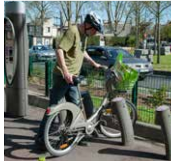
La bourse aux vélos, le Vélib' ou l'atelier vélo comptent parmi les nombreuses actions, municipales ou non, pour inviter à la circulation en deux-roues.