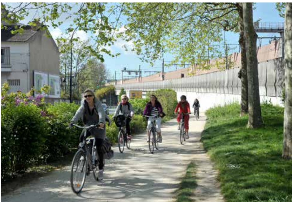
Nombreux sont les cyclistes à profiter de la coulée verte pour pédaler en toute sécurité.

met en place progressivement grâce à un partenariat entre les services de la Ville, les associations d'usagers comme Dynamo Malakoff, et les instances tel le CoPil. L'expérimentation de cinq zones de rencontre lors de la Semaine européenne du développement durable (30 mai-5 juin) fait également partie des propositions du Plan vélo. Elle repose sur un partage de la voirie (Cf. encadré p 19) pour tous : piétons, cyclistes, automobilistes. Un premier test avant, qui sait, une adoption définitive. Allez, circulez! ■