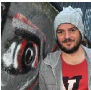
À voir Le monde selon Bojan