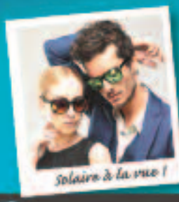
Solaire à la vue!