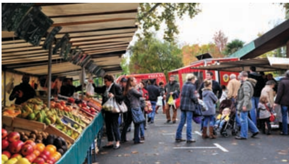
Convivialité et proximité pour le marché Barbusse, qui s'est rapproché, en septembre 2012, des commerces du rond-point.

On constate que les gens reviennent au marché. En période de crise, sa fréquentation ne baisse pas. La demande de produits locaux et/ou biologiques s'amplifie. Nous cherchons à développer cette offre, car c'est l'avenir du marché.