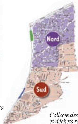
Collecte des ordures ménagères et déchets recyclables