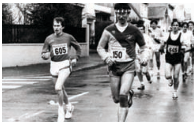
Les Foulées en 1986.