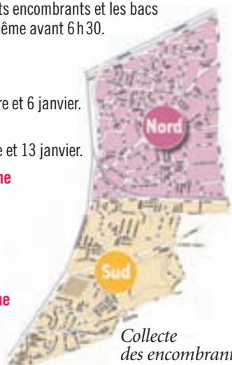
Collecte des encombrants