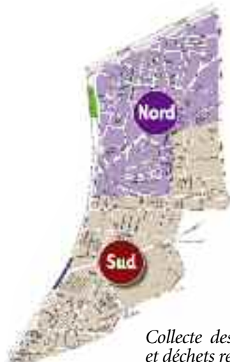
Collecte des ordures ménagères et déchets recyclables

Déchetterie rue de Scelle Tous les mardis de 13 h à 17 h 30 et le 1 er samedi de chaque mois aux mêmes horaires. Déchetterie de Châtillon Rue Roland-Garros. Tous les vendredis de 13 h à 17 h 30 et chaque 3 e samedi du mois.