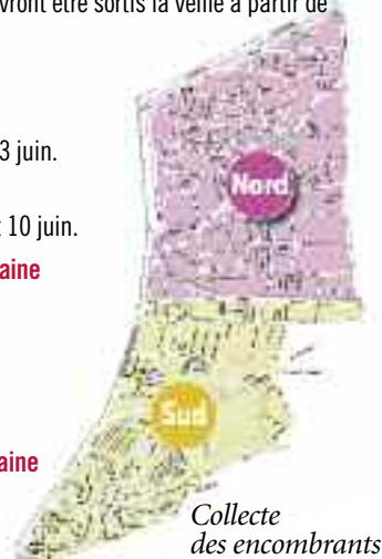
Collecte des encombrants