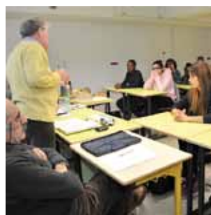
Histoire Échange et mémoire