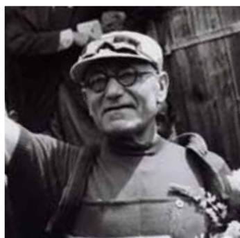
La section vélo de l'USMM comptait parmi elle de grands cyclistes comme Eugène Christophe, le premier porteur du maillot jaune sur le tour de France 1919.