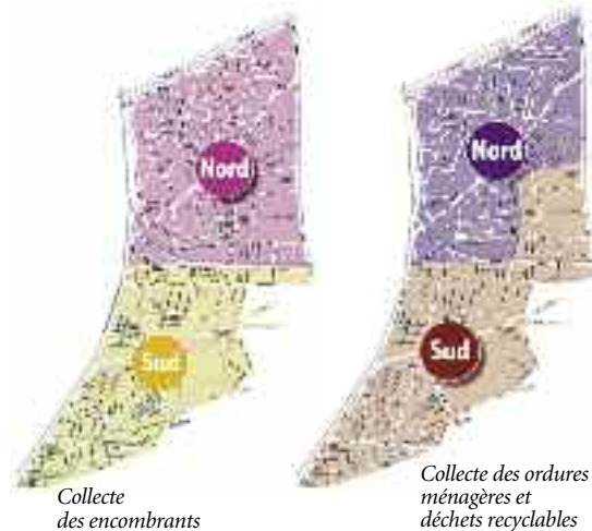
Collecte des encombrants

les jeudis 10, 17, 24 novembre et 1er et 8 décembre