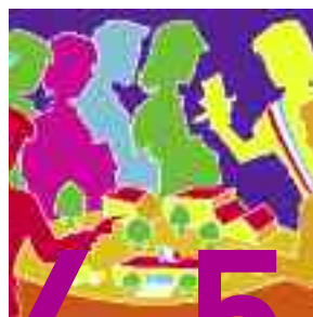
4-5 CONSEIL DE LA JEUNESSE