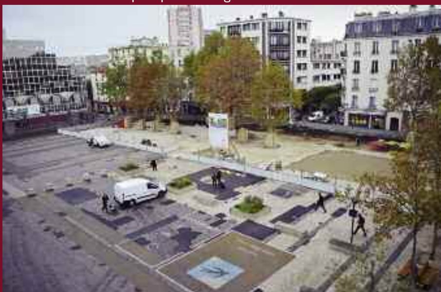
Vue de la place du Clos Montholon aménagée

Trois platanes malades ont été abattus pour des raisons de sécurité. Ces platanes ( Platanus acerifolia hispanica vulgaris ) ont souffert de l'usage de sel de déneigement, mais aussi de la maladie du "félin tacheté", due à un champignon attaquant l'arbre de l'intérieur, ainsi que d'un insecte, surnommé le "tigre du platane", se reproduisant sous l'écorce de l'arbre et l'affaiblissant.