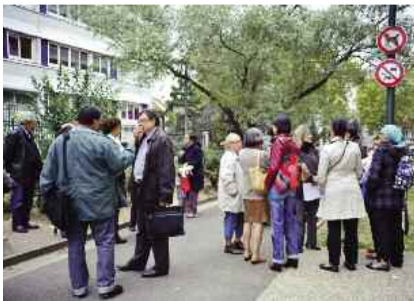
Résidence Prévert-Voltaire, discussion avec des habitants, dont des assistantes maternelles.

Une question décidément fort encombrante, mais que la Ville et Sud de Seine s'emploient à résoudre (voir page précédente).