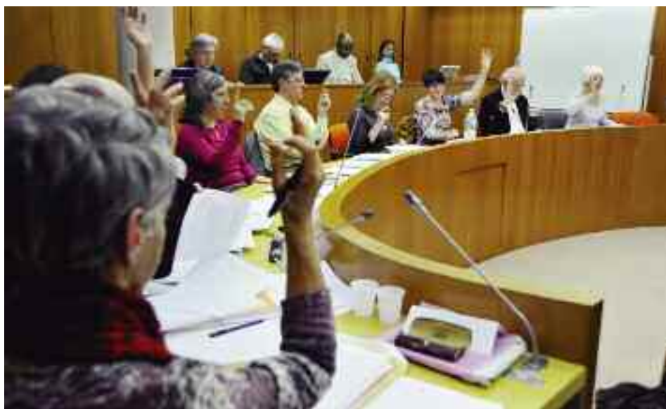
Le budget primitif, voté le 16 mars 2011 par le Conseil municipal, a été ajusté le 5 octobre.

Mi-octobre, le quotidien Libérations a publié sur son site internet une carte de France des villes touchées par les emprunts structurés dits "toxiques". Lors du Conseil municipal, Madame le Maire a tenu à rétablir la réalité des faits. En effet, l'emprunt en question, souscrit en 2005, a été renégocié dès 2007. « D'emprunt structuré à taux variable, il a été transformé en emprunt à taux fixe » a rappelé le premier magistrat qui a conclu : « Nous n'avons pas d'emprunt toxique. »