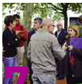
7 VISITES DE QUARTIERS Madame le Maire à l'écoute

Ce journal est imprimé avec des encres végétales sur du papier provenant de forêts écologiquement gérées.