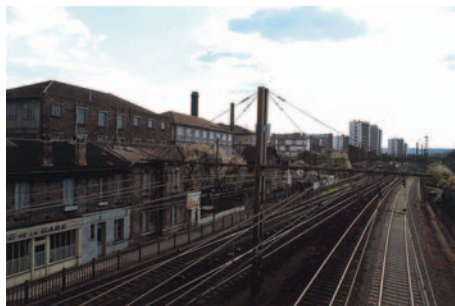
Vue de la villa Lacheux et de l'usine de la Caiffa (aujourd'hui démolie) depuis la passerelle de la gare (photo 1978, C. Bruant).

« Ils étaient plus de 700 pour la 37 ème . »