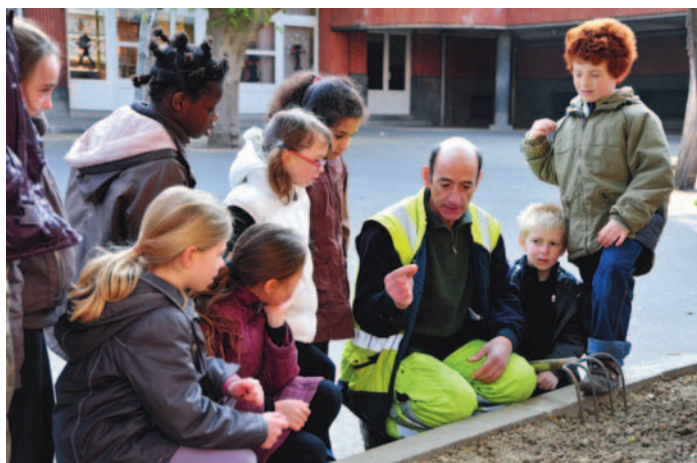
Laissons pousser : une opération de sensibilisation à la biodiversité.

Si la Coulée verte profite aux espèces animales et végétales qui la peuplent, elle bénéficie aussi à la population. Joggeurs, cyclistes et promeneurs, adultes et enfants,