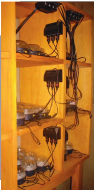
Lampes solaires en train d'être chargées.