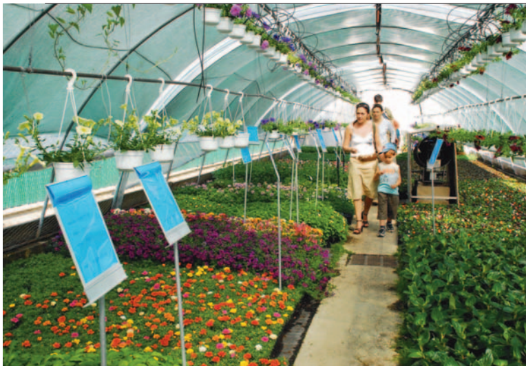
Samedi 30 avril, allez en famille visiter la biodiversité des serres municipales.