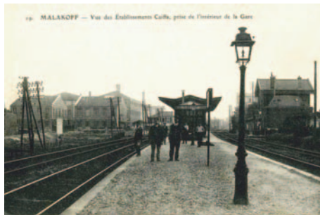
L'usine de la Caiffa vue depuis la gare, vers 1910.