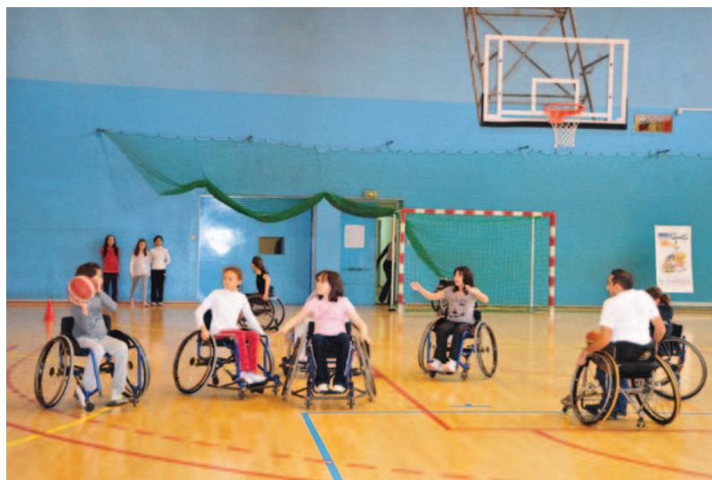
Les élèves de l'école Jean-Jaurès ont participé à une dizaine d'ateliers handisport (ici le basket en fauteuil).