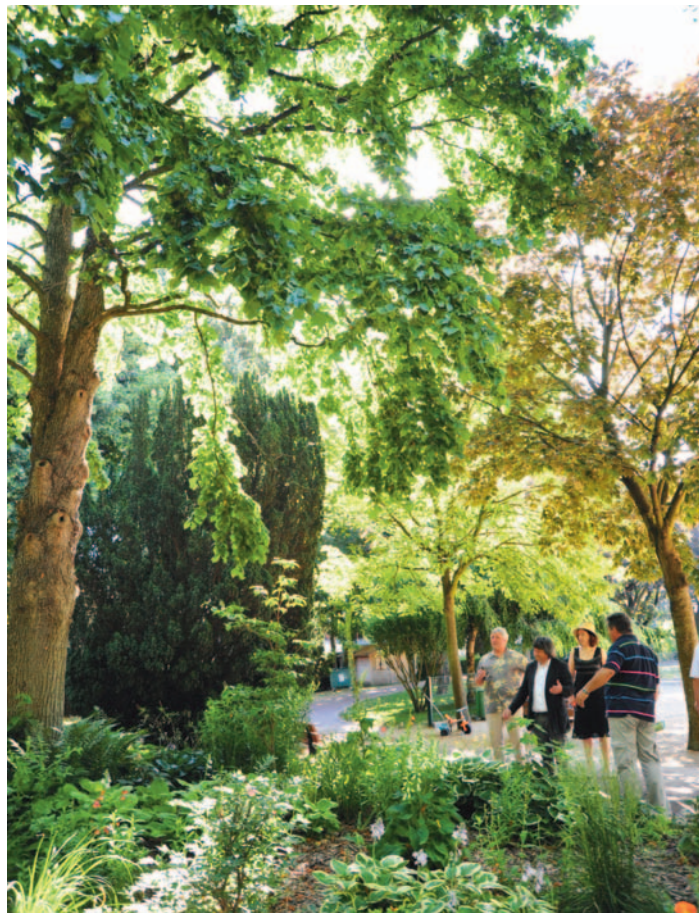
Le Parc Salagnac, un lieu où se côtoient de multiples essences.