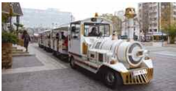
Le retour du petit train des commerçants.

Plus d'infos sur www.theatre71.com ou www.ville-malakoff.fr