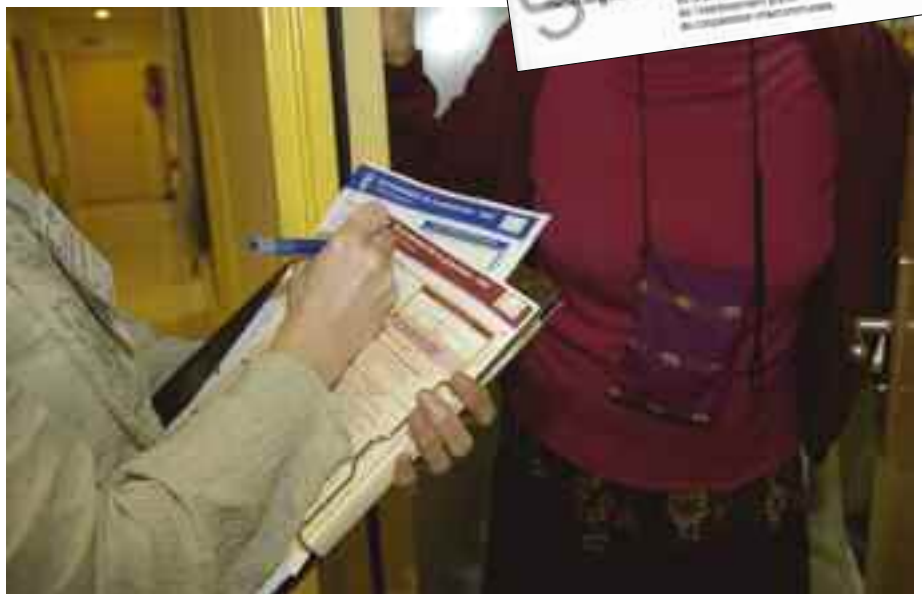
L'agent recenseur compte sur vous.

recenseurs, identifiables grâce à une carte officielle tricolore sur laquelle figurent leur photographie et la signature du maire, sillonneront la ville. Si votre logement appartient à l'échantillon recensé, un agent déposera à votre domicile une feuille de logement ainsi qu'un bulletin individuel pour chaque personne vivant habituellement dans ce logement. Il pourra également vous aider à remplir les questionnaires. Une fois complétés, ceux-ci devront lui être remis. Si vous êtes souvent absent de votre domicile, vous pouvez confier vos questionnaires remplis, sous enveloppe, à une personne de votre immeuble qui les remettra à l'agent recenseur. Vous pouvez également les retourner directement à votre mairie ou à la direction régio-