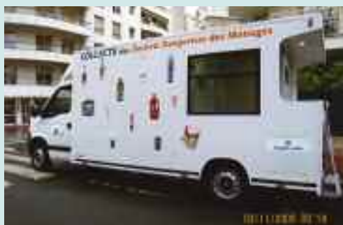
Le camion Triadis pour la gestion des vos déchets toxiques ménagers.

lundi du mois se poursuivent. Et pour que tout soit bien net et pratique, le camion Triadis, dédié aux déchets toxiques ménagers, sera également présent, tous les seconds mardis, au côté de la déchetterie mobile. Et, cerise sur le gâteau, le camion Triadis continue ses permanences, tous les quatrièmes dimanche, de 9 h 30 à 12 h 30, au même endroit.