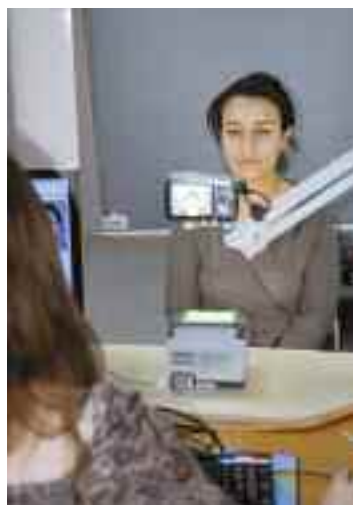
Courant avril, les machines servant à relever des données biométriques ont été installées. Elles ont nécessité la réorganisation des postes de travail du service de l'État civil.

Jusqu'à présent, les passeports étaient délivrés par la préfecture. C'est toujours le cas, bien entendu. Mais dans le cadre du passage au passeport biométrique, tout le travail administratif de recueil des données revient aux mairies. Compte tenu des relevés biométriques, le temps consacré à chaque usager est porté à une demi-heure. Le service étant ouvert aussi bien aux habitants de Malakoff qu'aux personnes y travaillant, le transfert de charge s'avère énorme, sans la contrepartie financière équivalente de l'Etat. Une illustration "exemplaire" d'un problème endémique qui plombe lourdement les finances communales.