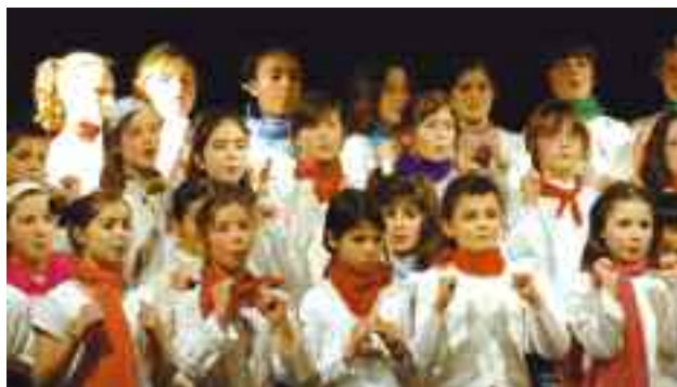
Cette année encore, une quarantaine d'élèves de l'école Paul-Bert a participé au festival de chœurs d'enfants en Essonne.

lement, les chants étaient en place ! C'est assez magique.», s'étonne encore leur professeur.