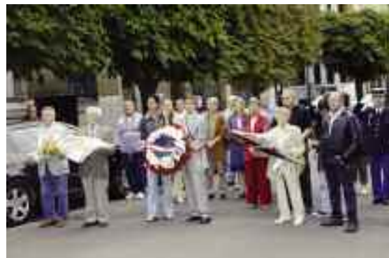
Les élus, aux côtés des Anciens combattants pour commémorer la cérémonie du 25 août. Transmission et passage de mémoire.