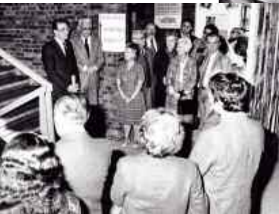
Toujours présent sur le front de la mémoire.

2005. Une grande dame. Ancienne déportée, elle aussi, militante de chaque instant, elle aussi. « Ensemble, ils avaient pris le chemin de l'action sans concession pour un monde meilleur ».