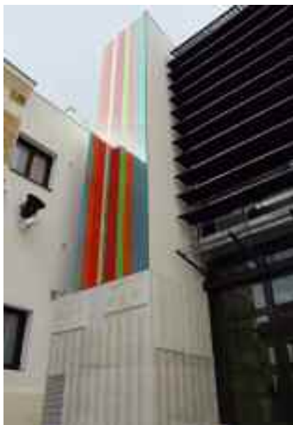
1132 noms gravés à l'entrée de la Maison de la Vie Associative nous rappellent les ravages de la guerre.