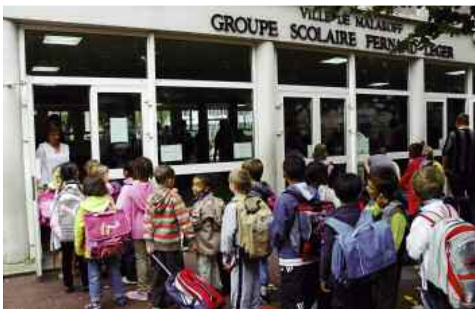
Le passage à la semaine de quatre jours fait perdre à l'enfant une année d'enseignement sur le 1 er cycle. Par contre, les classes sont toujours à trente de moyenne.