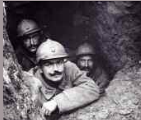
Collection Sirot Angel